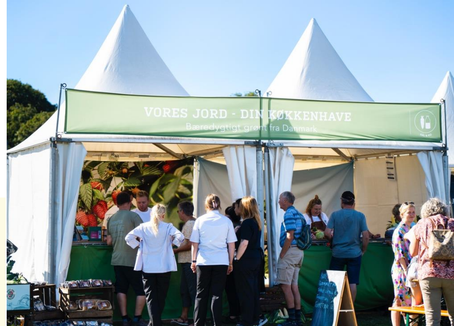
Foto viser to stk. 3x3 pagodetelte, der er sat sammen.