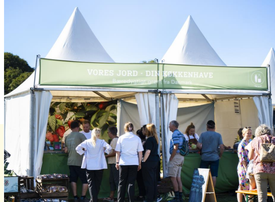
Foto viser to stk. 3x3 pagodetelte, der er sat sammen.